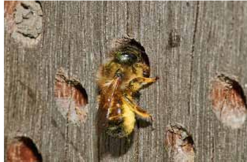
De "wilde" rosse metselbij met een vracht stuifmeel bij nest

V ereniging Natuurtuinen de Groene Schenk heeft als missie door middel van tuinieren de micro-fauna in een stedelijke omgeving in stand te houden en zo mogelijk uit te breiden.