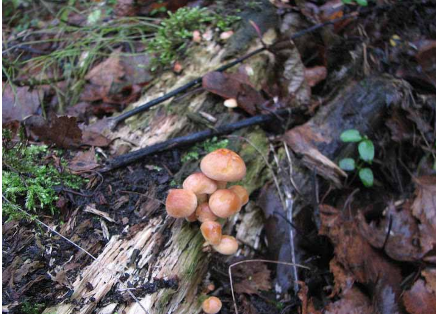
Kansen geven aan bijzondere flora en fauna