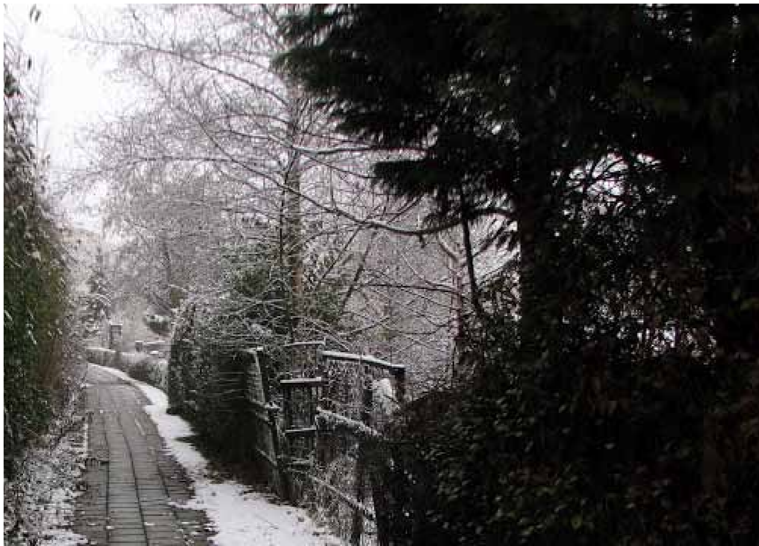
Winters beeld, voor de sanering

ter vergadering door een medebestuurslid laten vertegenwoordigen tegen overlegging van een schriftelijke dan wel elektronische volmacht. Een bestuurslid kan slechts voor één medebestuurslid als gevolmachtigde optreden.