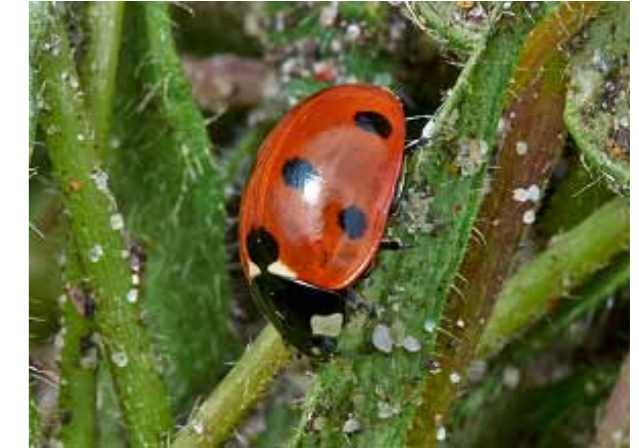
Zevenstippelig lieveheersbeestje. Bedreigd door het Aziatische veelkleurige lieveheersbeestje.

Alle foto's van microfauna zijn genomen ter plekke van de Schenkstrook bij het IJclubpad door Hans van Helden tenzij anders vermeldt.