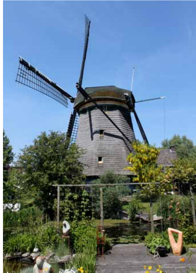
Uitzicht naar de molen vanaf Het Groene Oordtje