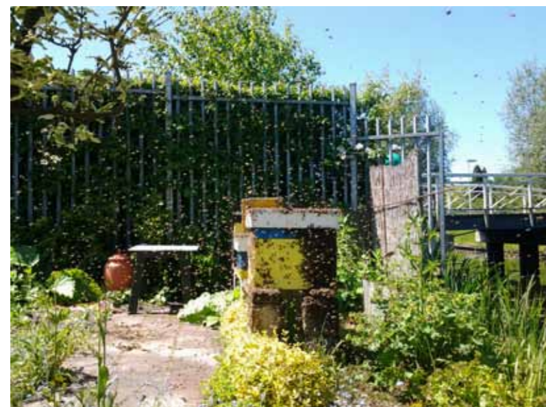
Koninginnevlucht: Bijen na terugkomst van de bevruchte koningin