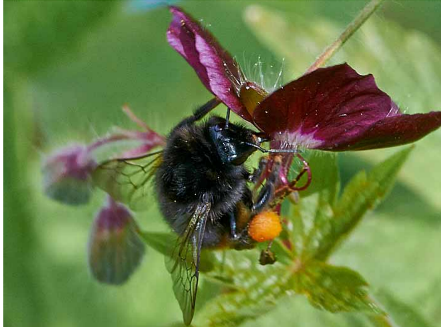
Steenhommel smult van geranium

http://rigolett.home.xs4all.nl/VNGS/groene%20schenk%20startpagina.html