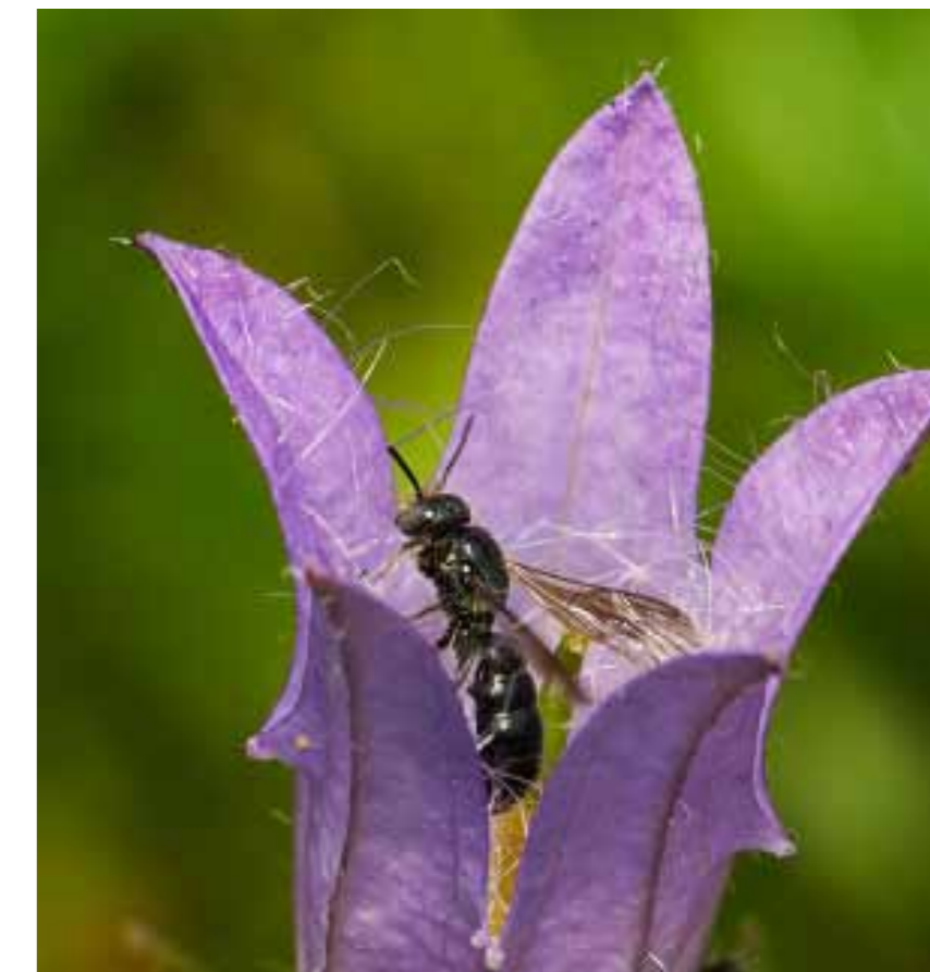
De klokjesbij. Uniek voor Den Haag en afhankelijk van de Nieuwe Veenmolen en Campanula

Als de nieuwe tuin is ingericht wordt een educatief plan opgezet om volwassenen en jeugd d.m.v. korte workshops kennis bij te brengen over het natuurvriendelijk tuinieren.