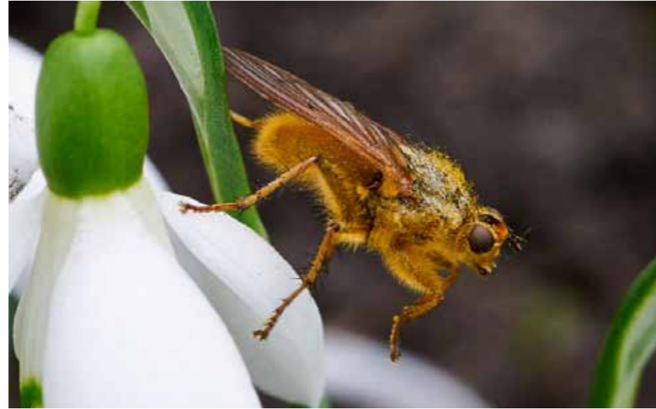
Vliegen zijn ook belangrijk voor de bestuiving van planten