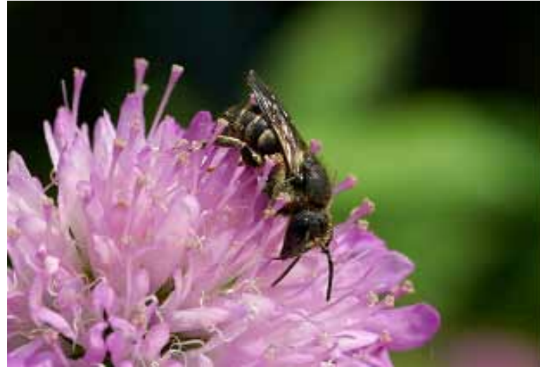
De zeldzame geelgerande tubebij. Deze willen wij ook behouden voor Den Haag