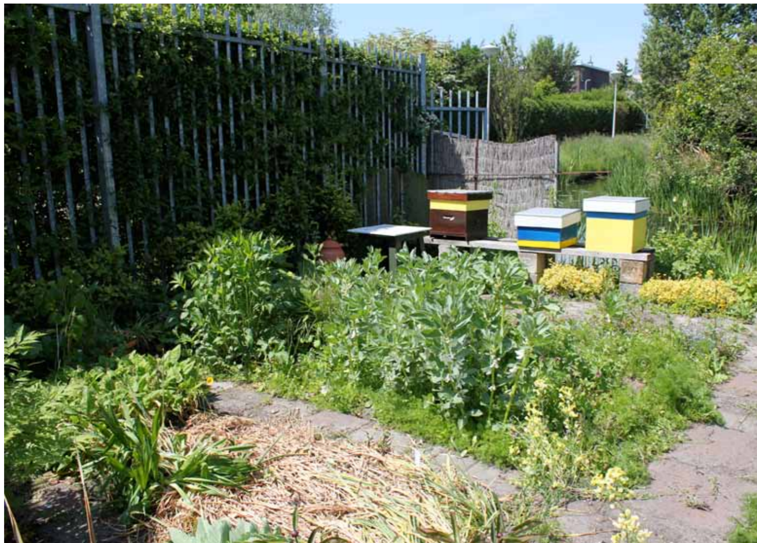
De moestuin en bijenstal