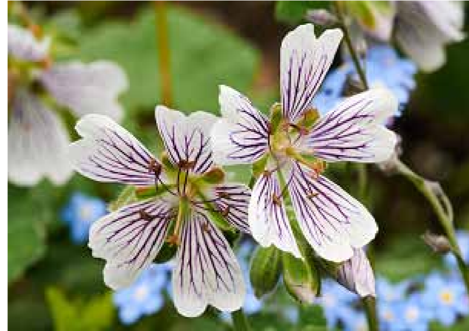
Geranium, mooi voor het oog en lekker voor veel bijen.

Vereniging Natuurtuinen de Groene Schenk werkt financieel onafhankelijk en met een langdurig gezonde financiële exploitatie.