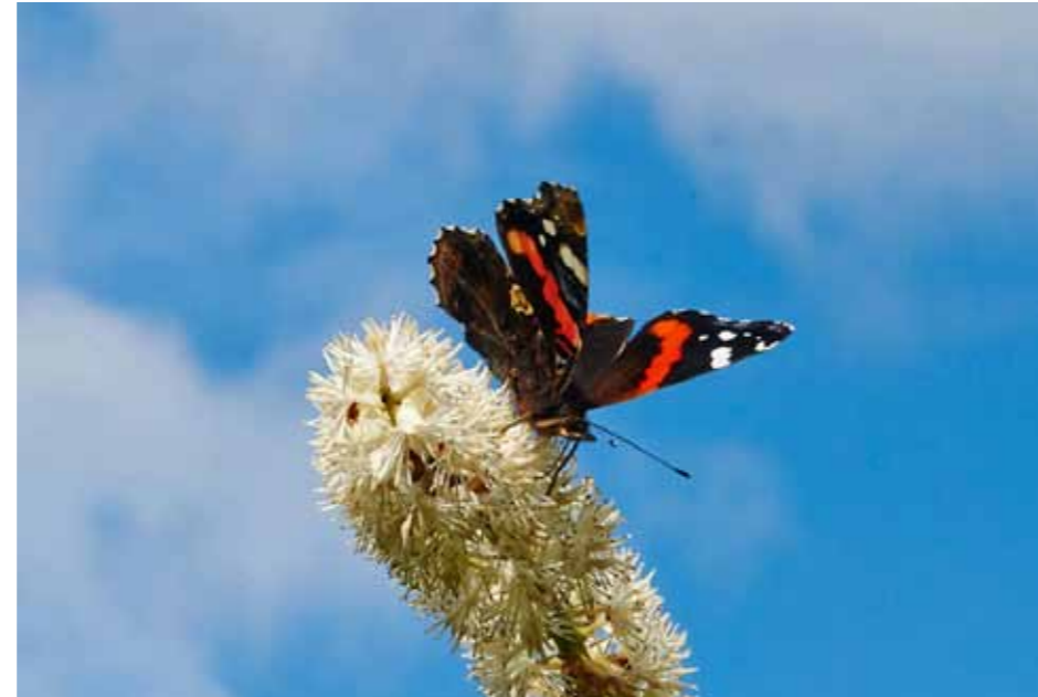
Uitbundige bloeiërs in het najaar zijn belangrijk voor insecten om goed gevoed de winter door te komen