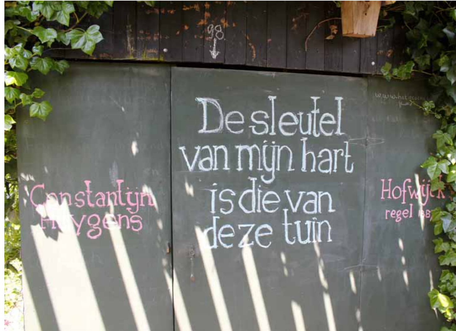
Motto van het Groene Oordtje