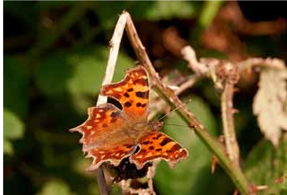
De gehakkelde aurelia heeft graag een plek om te eten en te rusten op haar trektochten