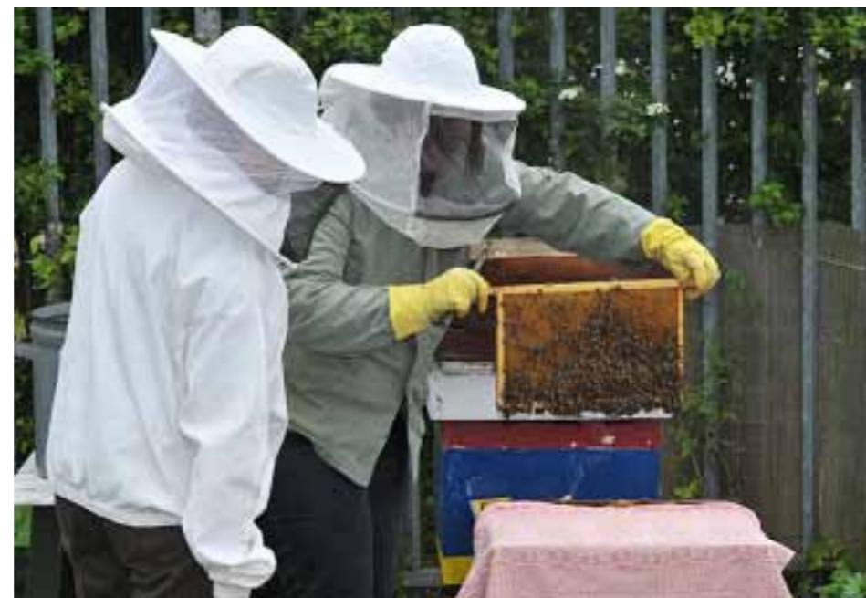
De imkers aan het werk