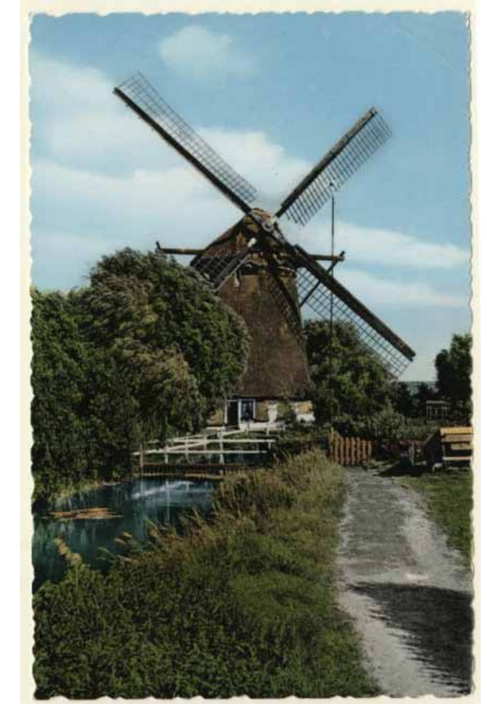
De Nieuwe Veenmolen sinds 1654, door zijn rieten bekleding biedt de molen veel nestgelegenheid aan insecten

Eind augustus 2013 gaat de tuin verhuizen naar de overkant van het IJscclubpad, waar bodemsanering reeds heeft plaatsgevonden. Dat stuk grond is 1200 m 2 groot en geeft de mogelijkheid om met vier geschakelde tuinen een gespecialiseerde tuinvereniging te exploiteren.