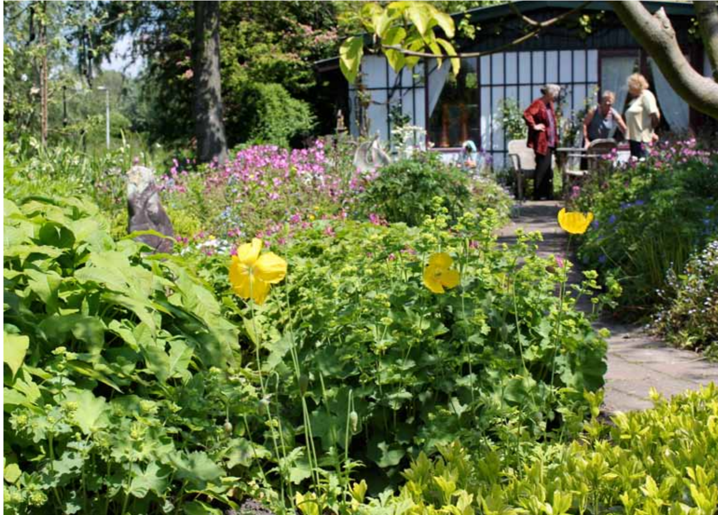
Het Groene Oordje