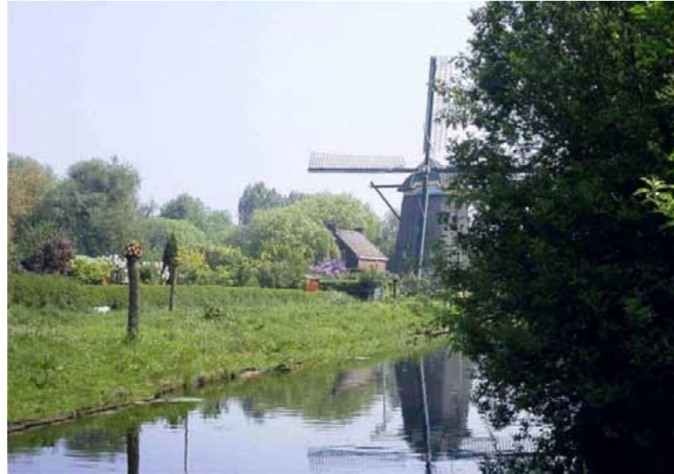
Uitzicht naar de molen vanuit de nieuwe plek