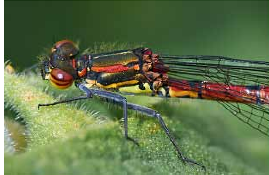
Ook libellen zijn onderdeel van de micro-fauna langs de Schenk