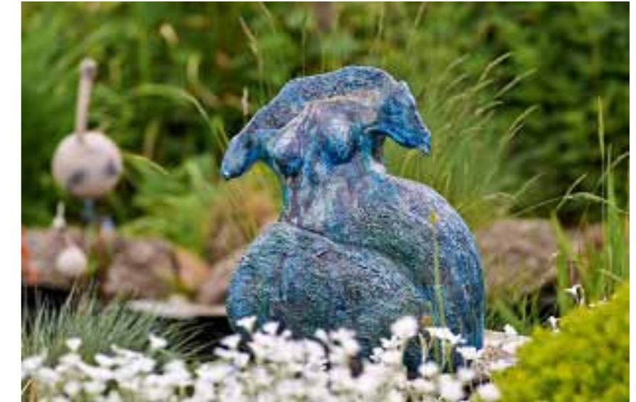
De tuin is een geschikte omgeving om kunst te presenteren. Op de foto keramiek van Jacqueline Louz